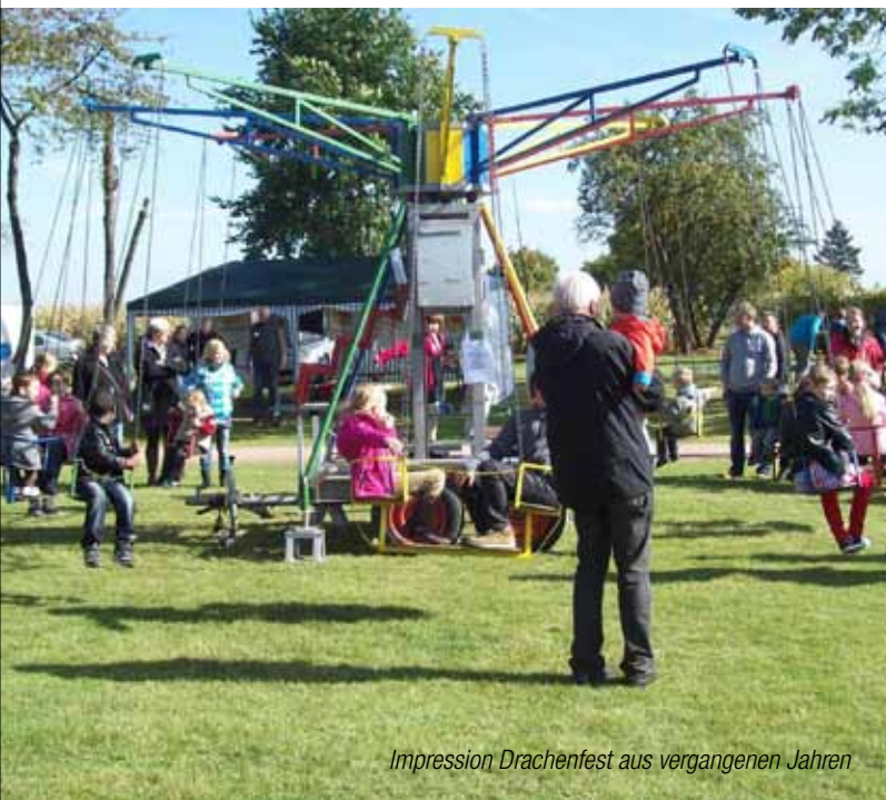
Impression Drachenfest aus vergangenen Jahren

Nicht nur für die Beschäftigung der Kinder, sondern auch für das leibliche Wohl aller, wird gesorgt sein. Je nach Wetterlage werden gegen 14:30 Uhr die Fallschirmspringer erwartet. Neben Wasserspielen mit der Jugendfeuerwehr und einer Kistenrutsche der Kolpingfamilie werden noch viele weitere Attraktionen angeboten. Durch viele mitgebrachte Drachen, die in die Lüfte steigen, ergibt sich hoffentlich ein buntes Bild am Himmel. (pd)